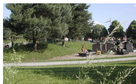
Cimetière d'Erstein Sud

Leur surface au sol conséquente au sein d'une commune en fait, souvent, le premier lieu d'accueil de la biodiversité. Les cimetières deviennent donc un lieu de promenade et un corridor écologique pour la faune et la flore . De plus, la présence de végétation et de nature apporte une impression de sérénité plus appropriée à ce lieu de recueillement.