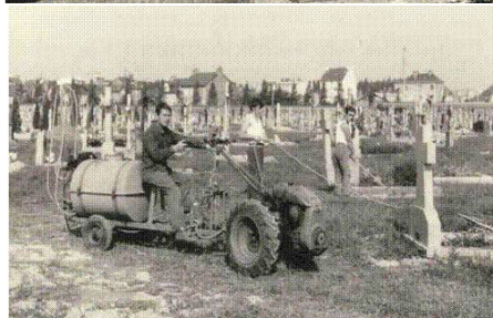
Cimetière de Rennes avant/après les années 70 Début de l'usage des désherbants