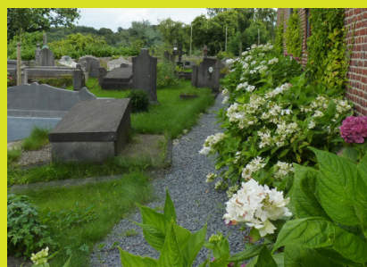
Cimetière de Lasne, Belgique

L'Europe du Nord est réputée pour ses cimetières où la nature est intégrée à l'aménagement et où la végétation spontanée est bien tolérée : Suède, Allemagne, Pays-Bas, Belgique, etc.