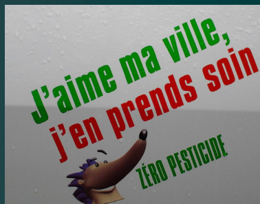
Erstein : stickers sur les voitures de la ville