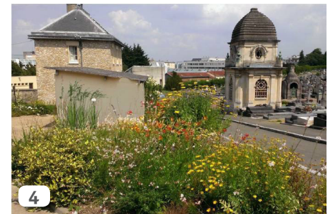
Entrée du cimetière des Gonards, Versailles