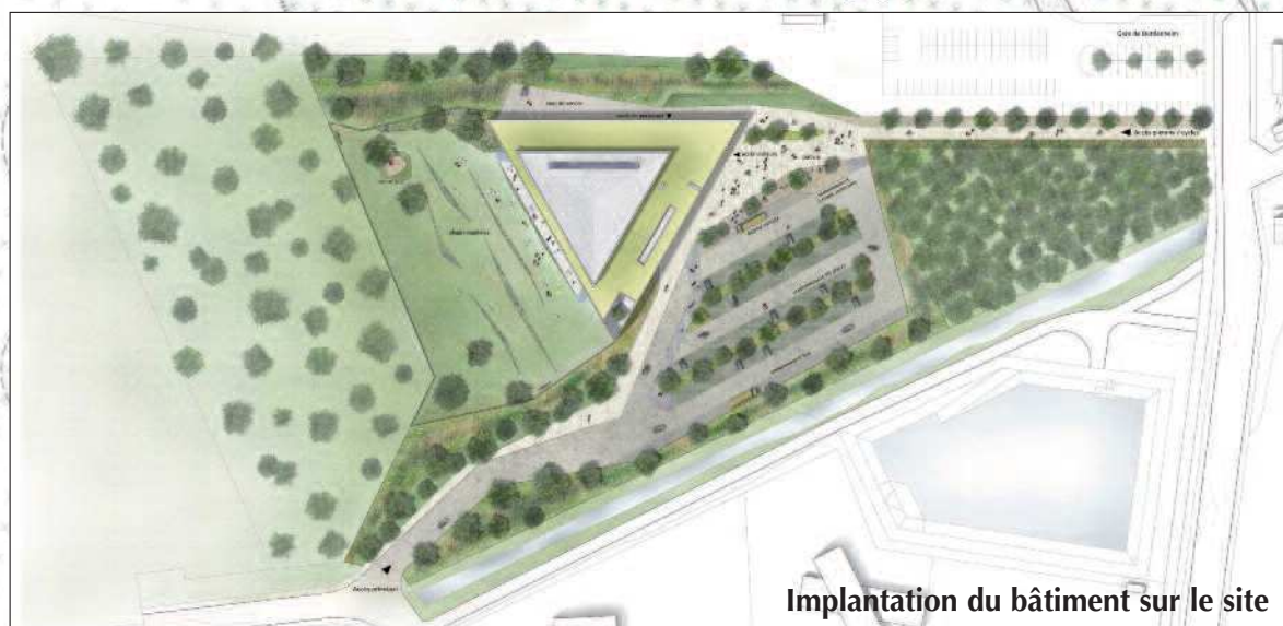
Implantation du bâtiment sur le site

2 L'aile Nord abrite l'ensemble des locaux techniques et administratifs. C'est un véritable espace tampon qui protège le reste de l'édifice quant aux problématiques thermiques et acoustiques (par rapport à la voie ferrée). La zone technique regroupe tous les locaux techniques de traitements d'eau, d'air et de stockage. Les locaux du personnel abritent également l'infirmierie.